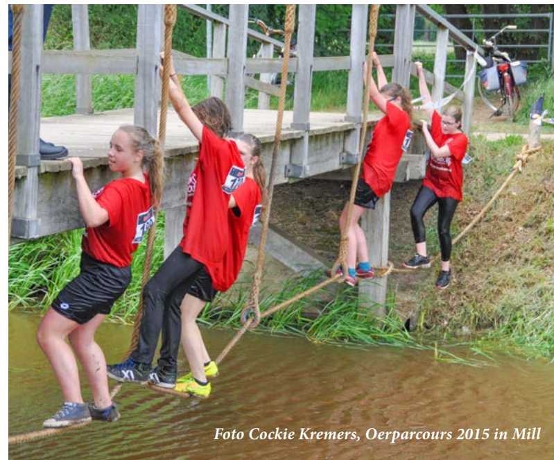
Oerparcours 2015 in Mill