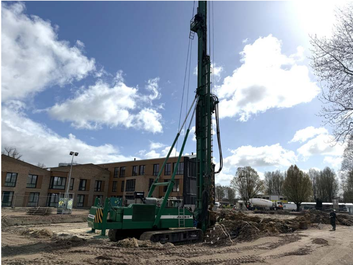
Het boren van de palen vormde de aftrap voor de bouw van het tweede deel van zorgcentrum Millstaete.

De bouw van het tweede deel van Huiselijke woonomgeving zorgcentrum Pantein Millstaete in Mill is gestart. Een mooie volgende stap richting de toekomst.