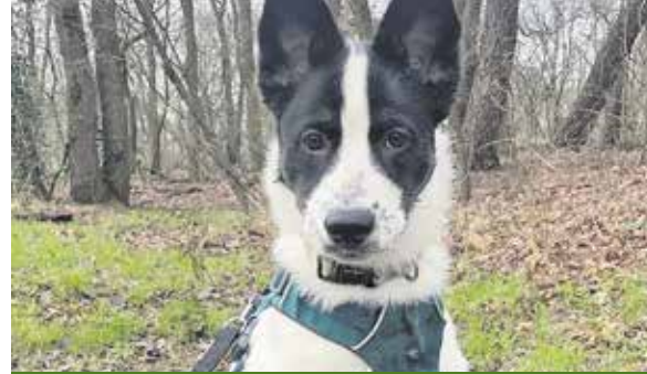
Asieldier van de week p. 26

vrijdag 5 april 2024 editie 559 | jaargang 13