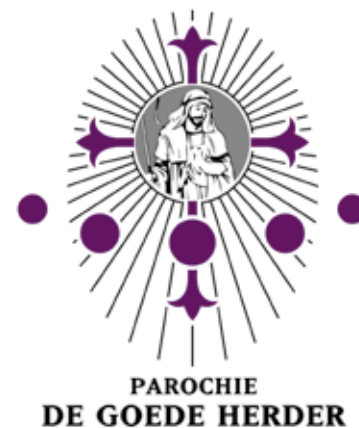
PAROCHIE DE GOEDE HERDER