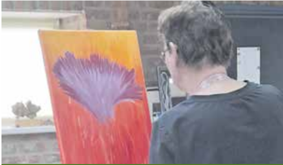
“(De)Flora in 't Land van Cuijk” p.7

Huis-aan-huis krant met nieuws voor en door inwoners van Wilbertoord, Langenboom, St.Hubert en Mill