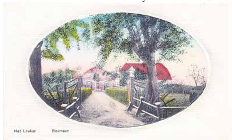
Ansichtkaart het Leuker, na de bouw en verbouw in 1901.

In mei/juni 1924 moest van Dartel zich verantwoorden voor de rechtbank in Den Bosch en in hoger beroep bij het Gerechtshof aldaar voor het overtreden van de Tabakswet omdat bij hem gebruikte banderolles werden aangetroffen, waardoor belasting werd ontdoken. Hij werd veroordeeld tot een boete van fl 100,- en bij niet betalen tot 20 dagen gevangenisstraf. Banderolles moesten bij de overheid gekocht worden, als belasting op rookwaren en die werden om sigaren gedaan en op doosjes sigaren geplakt. De kleinere sigarenfabrikanten die sigaren met de hand lieten