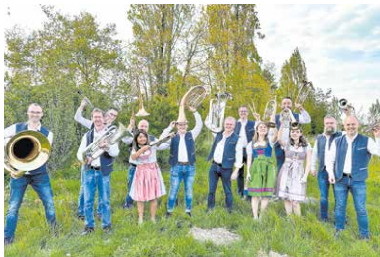
Blaaskapel Flamicanka uit het Belgische Oudsbergen.

De Rozenbottels openen het festival om 19.30 uur, de zaal is al open om 18.30 uur: kom op tijd naar de Posthoorn, Kerkstraat 6 in Haps. De entree bedraagt 5 euro.