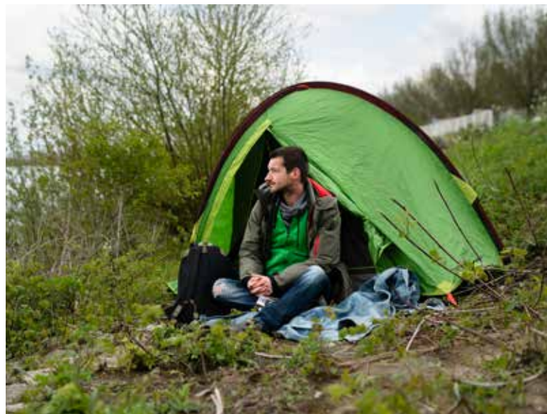
Relatief veel jongeren zonder dak boven hun hoofd in deze regio.