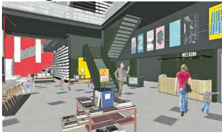
Schouwburg en bieb samen in één gebouw. De nieuwe entree.

CUIJK - Met veel enthousiasme en passie kunnen beide directeur-bestuurders vertellen over de op handen zijnde inpassing van de bibliotheek in de Schouwburg: "Onze samenwerking op één locatie biedt zoveel meer kansen zowel op literair-maatschappelijk gebied als op cultureel gebied."