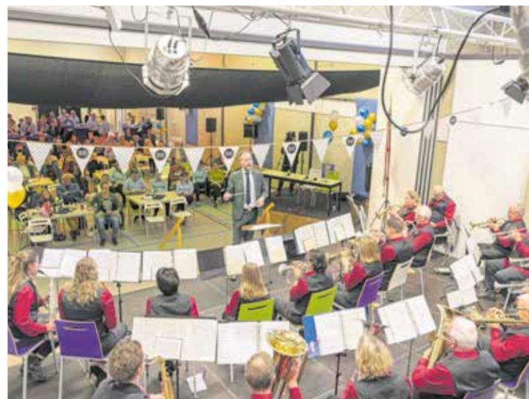
Fanfare Sint Agatha.

Speciaal is dat iedereen kan meezingen, dansen of zelfs meespeelen. Voor de jeugd is er gelegen-