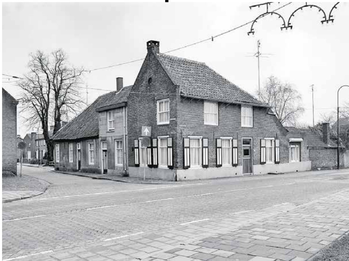
Het oudste huis van Cuijk op de hoek Vorstendom met de Smidstraat.