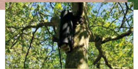
vleermuiskast op Weijerplein

Eerder in dit artikel hadden we het al over het flora- en faunaonderzoek. Dat is een verplicht onderzoek. Nu lijkt er qua flora en fauna weinig te gebeuren op zo'n plein, maar dat is toch meer dan we denken. Waar we in elk geval rekening mee moeten houden is dat er in de bomen op het plein vleermuizen kunnen huizen. In het najaar krijgen we de resultaten van het onderzoek.