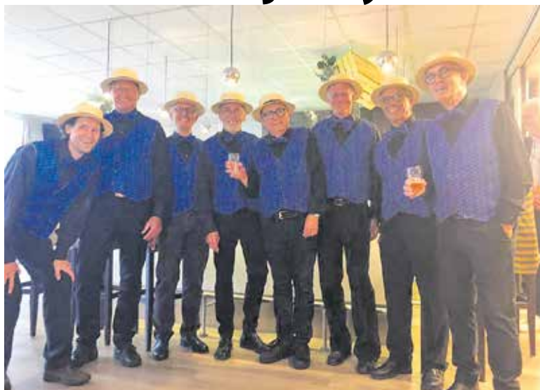
Mannenkoor uit Heijen.