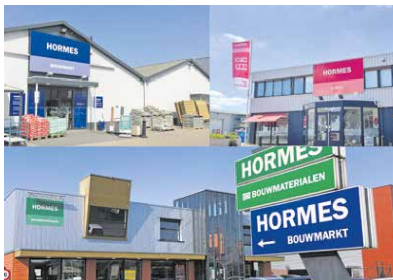
De panden van Hormes in Wijchen.

WIJCHEN - Op 1 januari 2023 bestond Hormes 100 jaar. Een mooie mijlpaal. Maar, 2023 kwam ook direct ongelofelijk druk uit de startblokken voor zowel Hormes Bouwmaterialen, Hormes Bouwmarkt als Hormes in Huis. Dus moest de viering even wijken; de klanten gingen uiteraard voor, al 100 jaar!