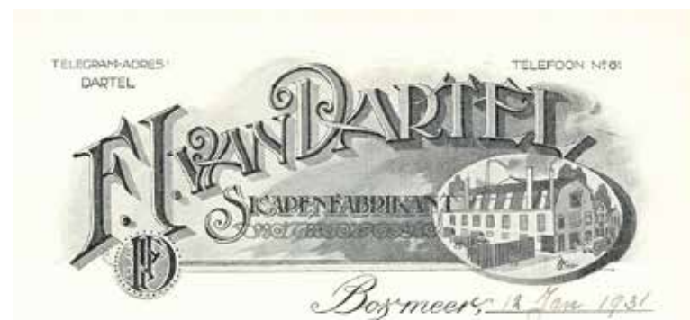
Briefpapier van Dartel.

Begin februari 1933 werd in de sigarenfabriek van van Dartel ingebroken, door via de noodtrap naar boven te klimmen, daar een ruit in te slaan en via een op de