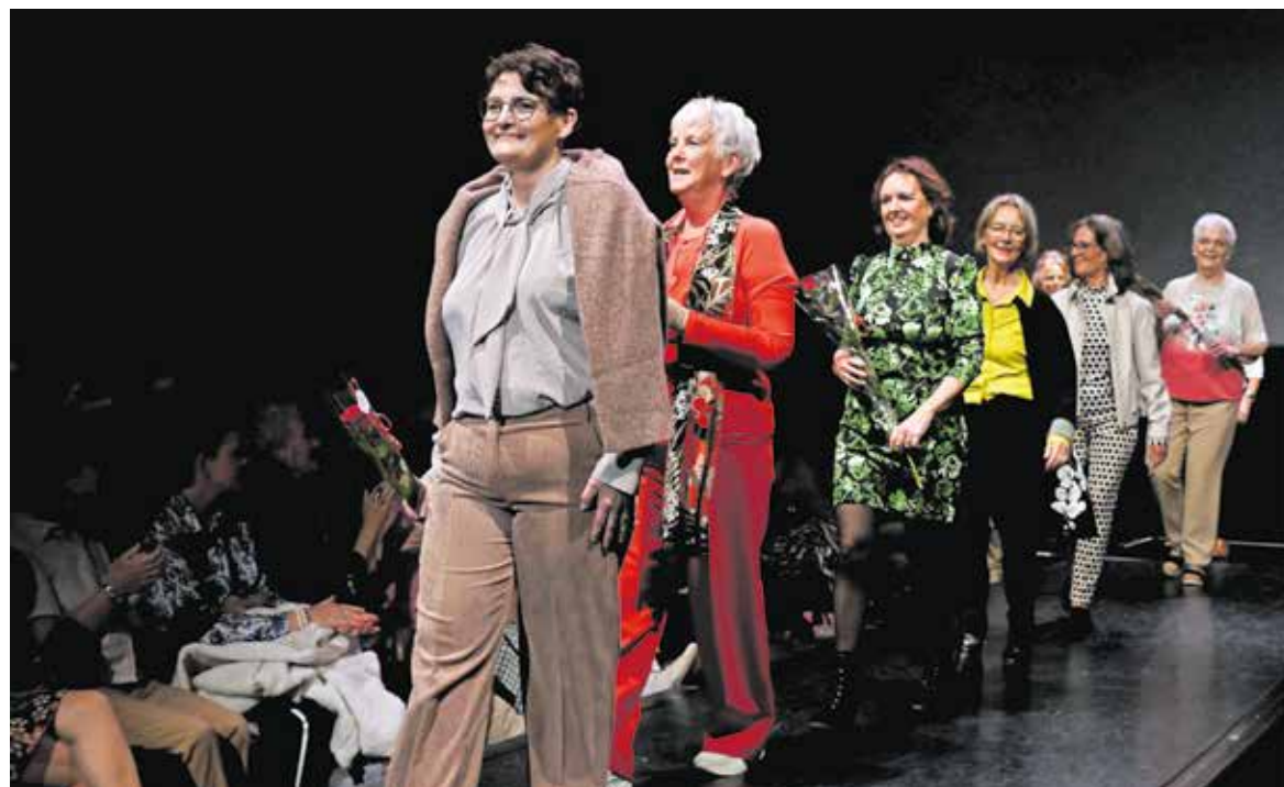
De afgelopen weekeinde gehouden modeshow met modellen die kanker hebben (of hebben gehad).