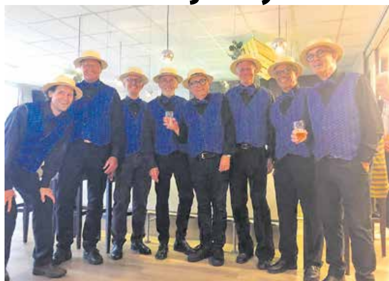
Mannenkoor uit Heijen.