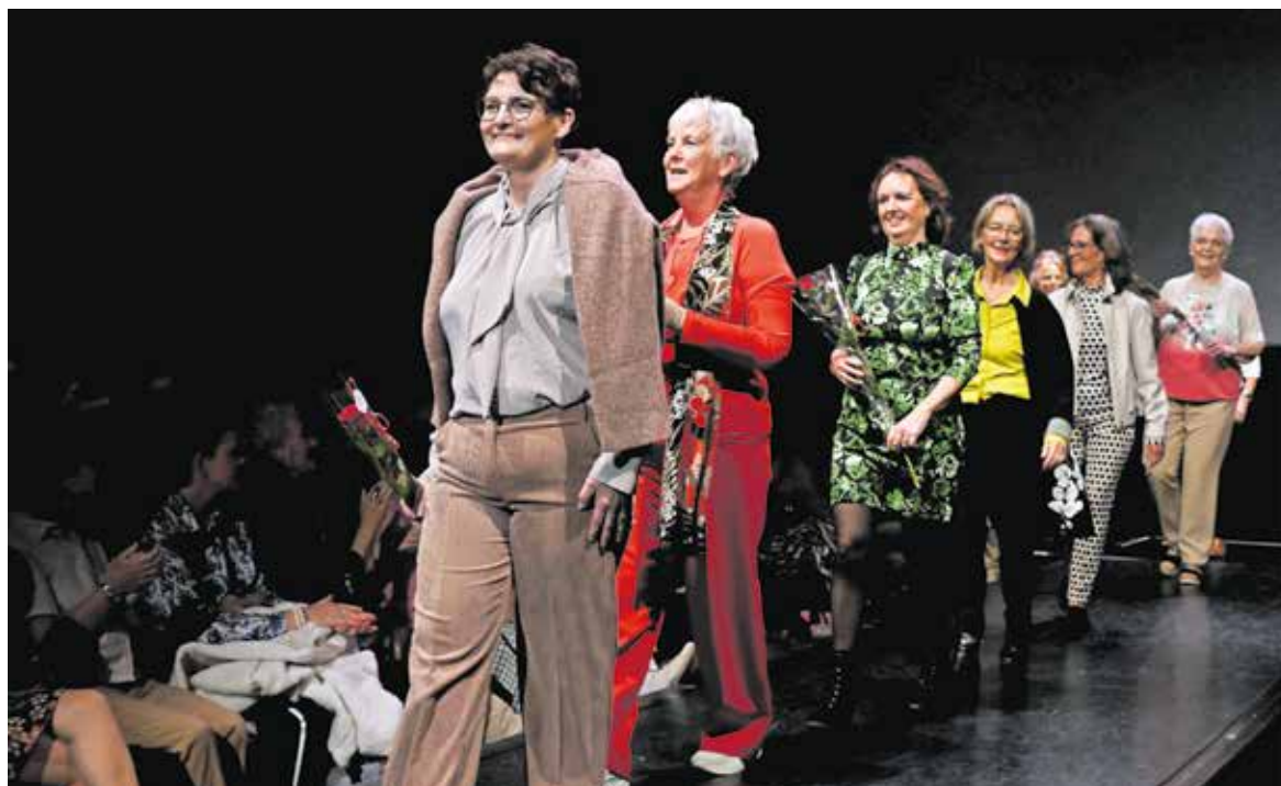
De afgelopen weekeinde gehouden modeshow met modellen die kanker hebben (of hebben gehad).