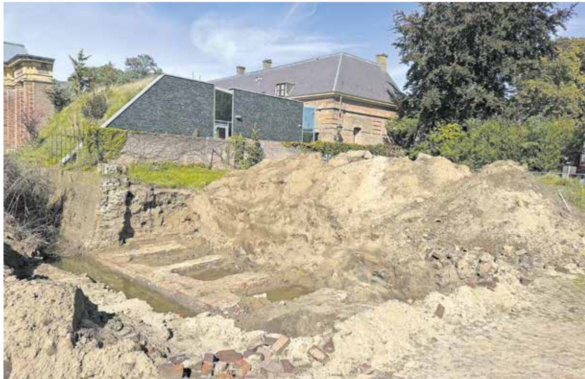
De gevonden stads muur

GRAVE - De gemeente Land van Cuijk is momenteel actief bezig met de herontwikkeling van het voormalige Visioterrein in Grave, waar voorheen een school van Koninklijke Visio voor leerlingen met een visuele beperking was gevestigd.