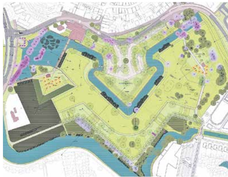
De schets en plattegrond van het beoogde en gewenste Visioterrein in Grave.