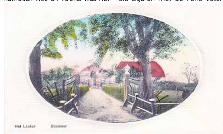
Ansichtkaart het Leuker, na de bouw en verbouw in 1901.

In mei/juni 1924 moest van Dartel zich verantwoorden voor de rechtbank in Den Bosch en in hoger beroep bij het Gerechtshof aldaar voor het overtreden van de Tabakswet omdat bij hem gebruikte banderolles werden aangetroffen, waardoor belasting werd ontduken. Hij werd veroordeeld tot een boete van fl 100,- en bij niet betalen tot 20 dagen gevangenisstraf. Banderolles moesten bij de overheid gekocht worden, als belasting op rookwaren en die werden om sigaren gedaan en op doosjes sigaren geplakt. De kleinere sigarenfabrikanten die sigaren met de hand lieten