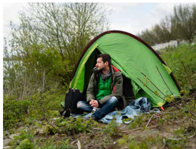
Relatief veel jongeren zonder dak boven hun hoofd in deze regio.