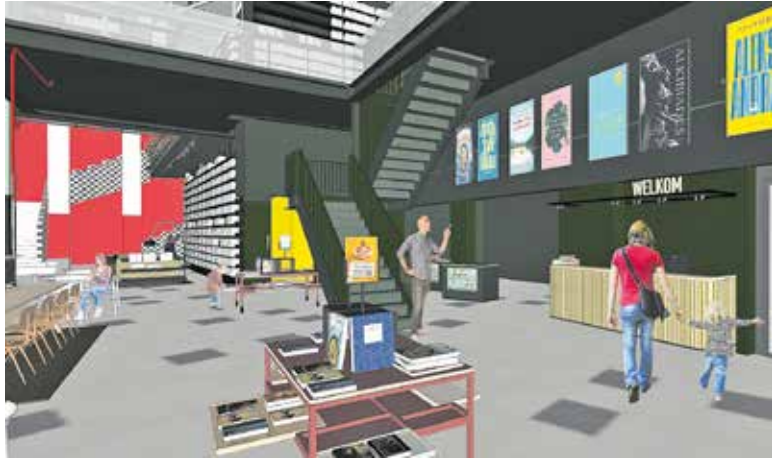
Schouwburg en bieb samen in één gebouw. De nieuwe entree.

CUIJK - Met veel enthousiasme en passie kunnen beide directeur-bestuurders vertellen over de op handen zijnde inpassing van de bibliotheek in de Schouwburg: "Onze samenwerking op één locatie biedt zoveel meer kansen zowel op literair-maatschappelijk gebied als op cultureel gebied."