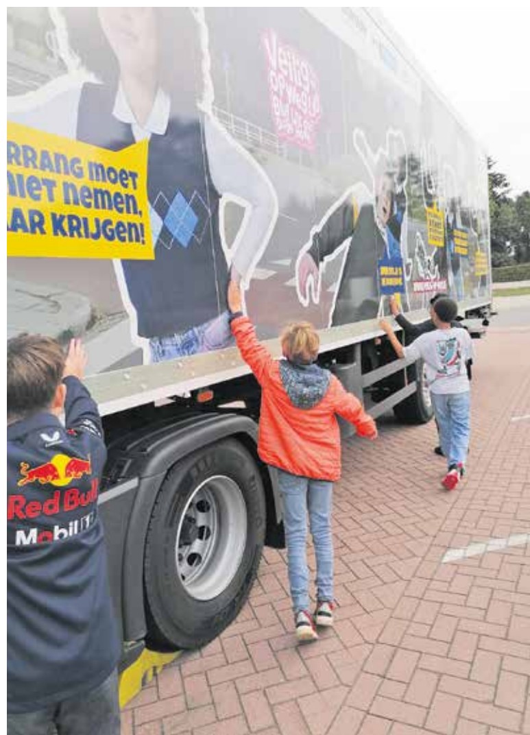
Leerlingen kregen tekst en uitleg over de 'dodehoek' van een vrachtwagen.

Na de les kunnen de leerlingen uitleggen waar ze rekening mee moeten houden wanneer zij een groot voertuig tegenkomen. De leerlingen zijn in staat om een groot voertuig te herkennen op basis van geluid. Zij ervaren de dimensies van een groot voertuig met tast. Tenslotte kunnen de leerlingen met hun gehoor inschatten of ze op voldoende afstand zijn van een groot voertuig. 'Veilig op Weg! Blijf uit de dodehoek' is het grootste dodehoek lesprogramma in Nederland en uniek in Europa. Jaarlijks worden door TLN, VVN en alle Veilig op Weg partners, zo'n 1500 basisscholen bezocht.