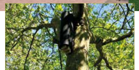
vleermuiskast op Weijerplein

Eerder in dit artikel hadden we het al over het flora- en faunaonderzoek. Dat is een verplicht onderzoek. Nu lijkt er qua flora en fauna weinig te gebeuren op zo'n plein, maar dat is toch meer dan we denken. Waar we in elk geval rekening mee moeten houden is dat er in de bomen op het plein vleermuizen kunnen huizen. In het najaar krijgen we de resultaten van het onderzoek.