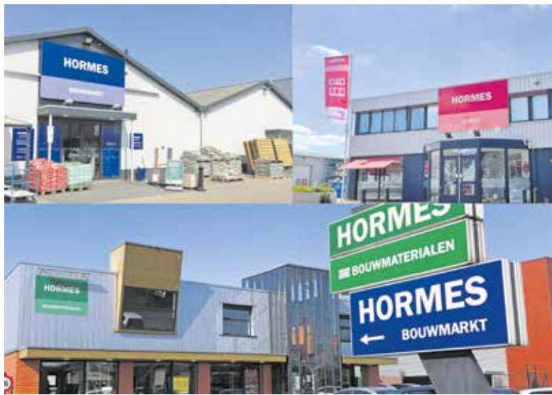
De panden van Hormes in Wijchen.

WIJCHEN - Op 1 januari 2023 bestond Hormes 100 jaar. Een mooie mijlpaal. Maar, 2023 kwam ook direct ongelofelijk druk uit de startblokken voor zowel Hormes Bouwmaterialen, Hormes Bouwmarkt als Hormes in Huis. Dus moest de viering even wijken; de klanten gingen uiteraard voor, al 100 jaar!