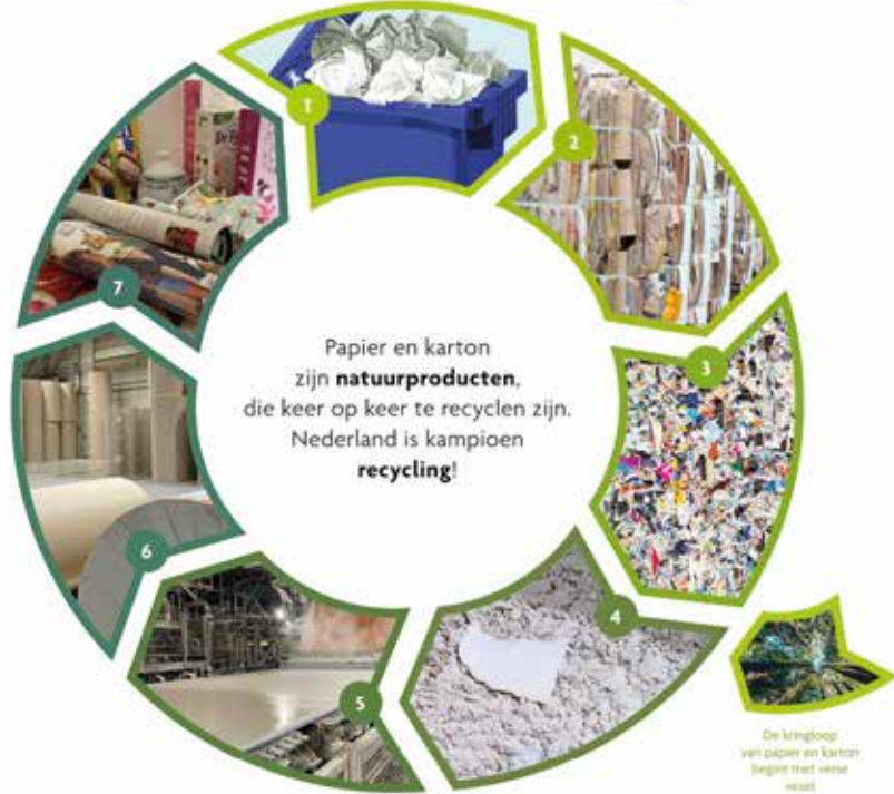
De kringloop van papier en karton begint met verse weiland

De Donald Duck van vandaag is de krant van morgen