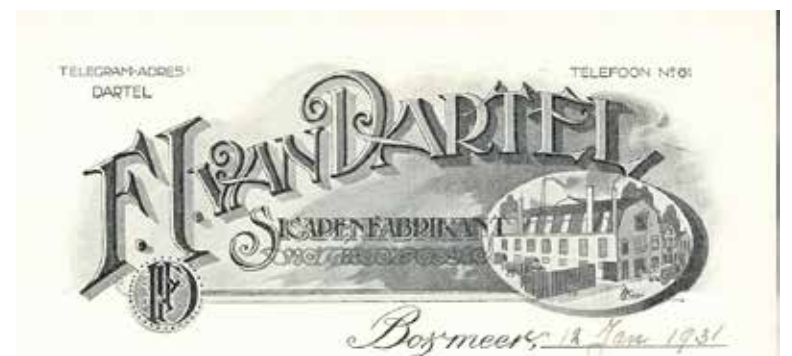
Briefpapier van Dartel.

Begin februari 1933 werd in de sigarenfabriek van van Dartel ingebroken, door via de noodtrap naar boven te klimmen, daar een ruit in te slaan en via een op de