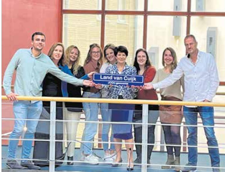
De wethouder en samenwerkingspartners van de GGD en JOGG gezonde jeugd, gezonde toekomst.

LAND VAN CUIJK - In Land van Cuijk heeft gemiddeld 11% van de kinderen tot 15 jaar overgewicht of obesitas (Bron: GGD Hart voor Brabant). Dit kan op zowel korte als lange termijn vervelende gevolgen hebben.