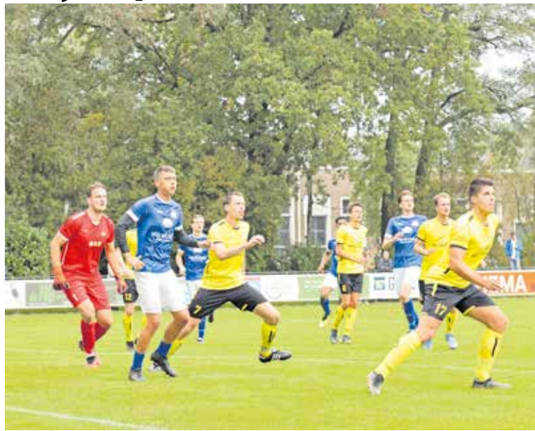
Tegen Boekel verloor de Boxmeerse ploeg.