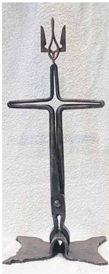
Het smeedijzeren kruis gemaakt door Juul Baltussen uit Westerbeek.

En ook Serhii Polubotko, die inmiddels uitgeweken is naar New York, gaf via een video-verbinding bij de opening acte de présence.