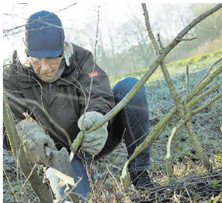
Het ambacht van heggenvlechten leren?